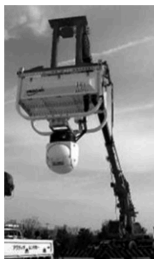
バードビジョンの運用例

埼玉県は、クレーン車のブームの先端に「超高性能防振カメラ」(バードビジョンカメラ)を取り組む独自のノウハウ「バードビジョン」の本格的運用を開始した。新たに社内「バードビジョンプロジェクト」を立ち上げ、事業拡大を