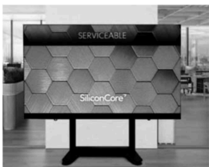
135型モバイルAIOディスプレイ

アストロデザインは、シリコンコア・テクノロジー(横浜市港北区)の135型モバイルAIOディスプレイを開発し、国内における販売代理店業務を開始した。