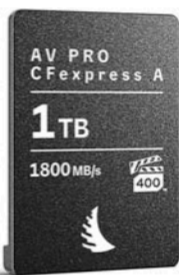
AV PRO CFexpress A 1TB 1800MB/s

銀座十字屋ディリгент事業部が発売 CFexpress Type Aカード ソニーFX3やα1などに対応