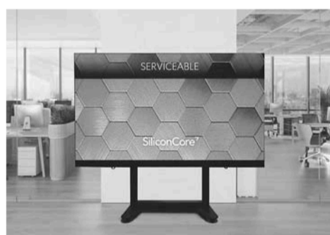
135型モバイル AIO ディスプレイ

ASTROデザインは、シリコンコア・テクノロジーの135型モバイルAIO (All in One) ディスプレイについて、日本国内における販売代理店業務を開始した。