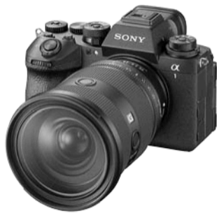
α 1 II (FE24-70mm F2.8 GM II装着)