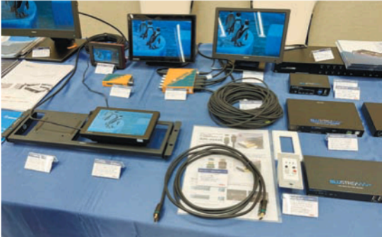
エーディテクノは、抜け防止のためのロック機構付き3.8Gbps対応HDMIケーブルを展示