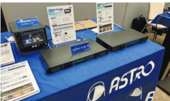
アストロデザインは12G-SDIオーディオモニターAM-3825、4K120p対応ポータブルレコーダーIR-7523を展示

また、アストロデザイン製のSRT交換装置「R5004」で会場カメラ映像をSRTストリーム化し、ストリーム映像を加賀電子取り扱いのPicco C-ELA製メッシュWiFi装置を介して会場内伝送、受け側としてパナソニックKAIROSへSRTストリームを收容しライブ素材として利用するデモも見せた。