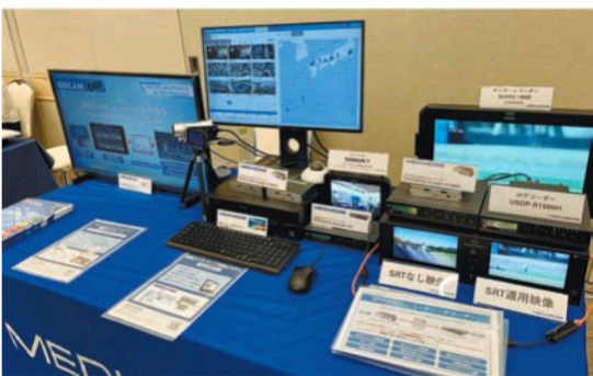
MEDIAEDGEはループ映像収録システム LoopRECや、T-Vプロビアを使ったSTBレスサイネージをデモ