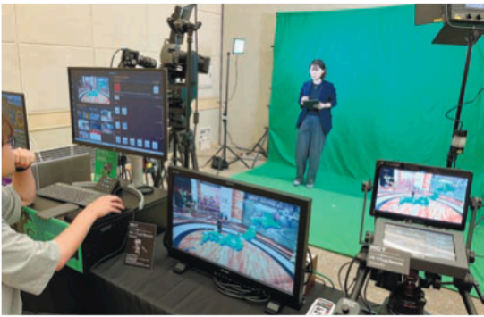
アスクは、リアルタイムバーチャルプロダクション合成ツール Qimera (キメラ) をデモ

伊藤忠ケーブルシステムは8月21、22日、プライベートショーを大阪市中央区のオービックホールで開催した。パートナー企業がブースを構える形式で、13社が展示に参加した。