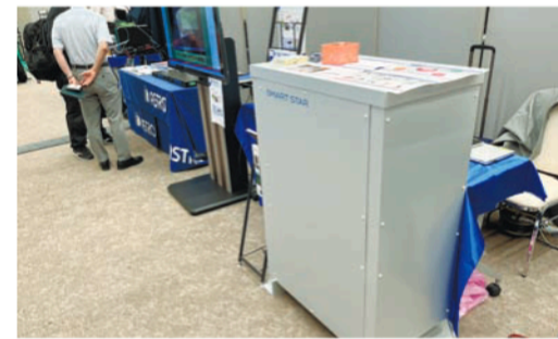
テレストリームは、AIが言語を認識してワークフローを自動で組み立てる。開発中クラウド版トランスコーダーVantageをデモ