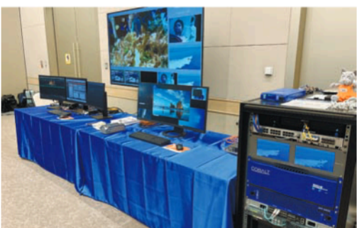
ヒビノブースでは、シュア製デジタルワイヤレスマイク、スピーカー内蔵天井マイクなどを展示

し、同地区でのビジネスを最大化することが開催の目的。大阪・関西万博の時期に開催することに開催を来年に控えていた」と話した。