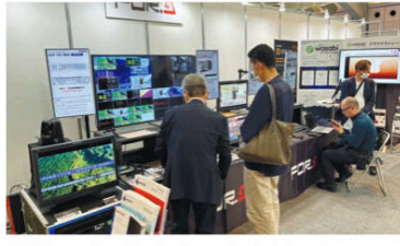
朋楽の3G/HDポータブル1M/Eビデオスイッチャー「HVS-190S」、4K/HDキャラクタージェネレーター「EzV-410」はいずれもNDI入出力対応(オプション含む)。技術参考展示のビデオプロセッサ「NVP-100」(仮称)はSDI・NDI変換機能搭載