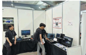
メディアインテグレーションは、ネット回線にDanteを乗せ、他拠点の音声をAWSクラウド上で遠隔操作し、非圧縮音声中継する実験をした。映像の伝送はNDIを使用