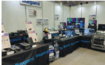
池上通信機は伝送装置および4K/2Kスイッチャー、IP/SDIハイブリッドシステム対応のシステム統合管理ソフトをそろえた