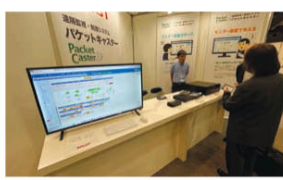
アプコットの遠隔監視・制御システム「Packet Caster(パケットキャスター)」は送信所や中継局内にある機器・設備をウェブブラウザで一元管理。異なるメーカーの機器情報も1つの画面で監視・制御できる