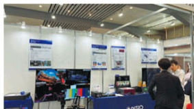
アストロデザインは4K・2KIP、SDI対応マルチビューワー「MV-2200」を、LG社製でカラーグレーディングの最終確認用にも使用できる65型業務用OLED Dリファレンスマニター「65EP5G」で出カ