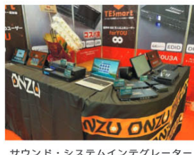
サウンド・システムインテグレーターはTE Smart社のKVMスイッチ、MST KVMドッキングステーション、HDMIマトリクスルーターを初出展