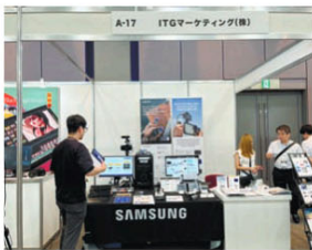
Samsung SSD/ITGマーケティングのブース