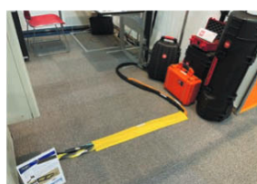
ニッキャビが輸入販売を開始したばかりのカーペットコードカバー「DURARACE」は、パリストティックナイロンでしっかりと編まれているという