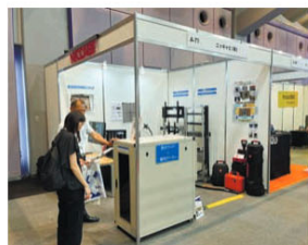
ニッキャビブースには静音ラック+筐体用クーラーモデルを設置