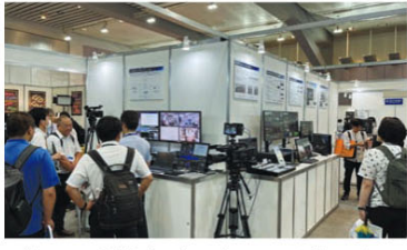
パナソニック製IT/Pプラットフォーム「KAIIROS」はクラウド版およびオンプレミス版をデモ。オンプレはInter BEE 2023で発表のSDI標準対応新メインフレームKairos Core 200 AT-KC200TL1を実演した