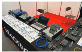
ビデオトロンはマイクロBNCを採用した省スペースでローコストなVbusシリーズ新製品を展示。従来比1/2以下の省スペース化を実現するVbusモジュールもある