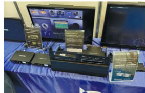
E-TECはDante AV Ultraエンコーダー/デコーダー「DAV-01ST/D AV-01SR」を参考出品。4Kビデオを1GbEネットワーク上でサブフレームの遅延なく伝送する