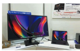
アイ・オー・データの31.5型4K対応&広視野角ディスプレイは、DCI-P3カバー率95% (対sRGB) 広色域パネルを採用し、Mac環境により近い色彩を大画面化および、キャリブレーションセンサーを組み合わせた