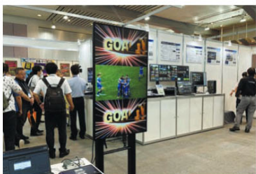
パナソニック コネクトはデジタルサイネージソリューション「AcroSign(アクロサイン)」を、スポーツイベント演出の想定でデモをした