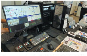
SamsungブースではDENDEN社が配信の現場で提供する収録から編集までのクラウドワークフローにSamsung SSDを連携させ、高速データ転送による時間短縮、コンテンツの安全な運用を実現