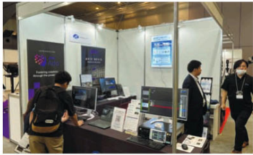
レスターはガラスパレー「T3Series」を関西初展示。ディスクレコーダーT2の上位モデルで、4Kを最大2チャンネル収録または再生。多くの4Kフォーマットにネイティブ対応する

関西最大級のプロフェッショナル向け放送業務用機器展「第9回関西放送機器展」(主催者セミナー)が7月10、11日の2日間、大阪市住之江区の大阪南港ATCホールで開催された。80社以上が出展した会場は賑やかな様子で、2日間で2万79人が来場したと発表があり、展示規模、来場数ともに昨年同様であったことを示した。 今年には主催者セミナー「関西放送機器展」(主催者)による基調講演をはじめ、FNN系列の放送局ウェブ応援、テレビ北海道に「ブレイク」によるモニターリモート監視、テレビ大阪フルHD「新社報」パネルディスカッション「コンテンツ制作におけるAIの活用」、特別講演「始まるAI活用、まずは「AIカメラ」(映像新聞社)」。会場には「映像新聞社」のブースもあり、展示規模、来場数ともに昨年同様であったことを示した。