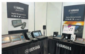
ヤマハは放送局・プロダクション、ライブイベント向けデジタルミキシングコンソールDM7シリーズ、Dante標準対応のDM3を展示した