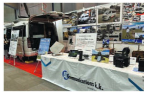
E-TECコミュニケーションズは、超小型平面衛星アンテナ「Satcube」(サブキューブ)や、リチウムイオン電源搭載のハイエースSNG中継・伝送車を出版