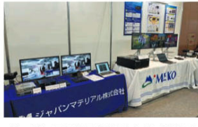
ジャパンマテリアルはBrightSign製サイネージ新製品「シリーズ5」やMatrix製ストリーミング配信エンコーダー「Maevex6100」のほか、ビデオウォールコントローラーを展開するメイコートと共同デモをした