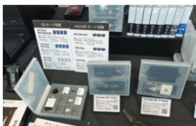
Samsungの高速ポータブルSSDはデータの保管や受け渡ししやすい専用ケースを用意。同社SSDは各種映像機器との動作確認済み