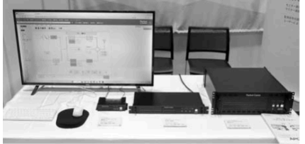
遠隔監視・制御システム

アプロコットは、遠隔監視・制御システム「PacketCaster (パケットキャスター)」、遠隔監視・制御装置「PacketCaster Terminal (ターミナル) Pro」(「Std」同Mini) を展示する。 「PacketCaster」と「PacketCaster Terminal」は、送信所や中継局内にある機器・設備を、監視制御装置を