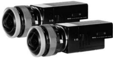
16K8KステレオVRシステム