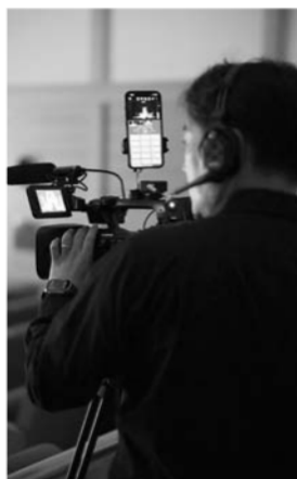
Canon Multi-Camera Controlの使用イメージ