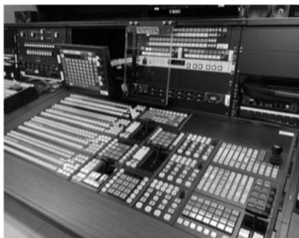
スカパーJSATのMuPS-5000操作卓

池上通信機は、北陸朝日放送に4K/HDポートカメラシステム「UHK-X700」を納入した。情報・報道番組で運用されている。UHK-X700は、ニューススタジオに導入さ